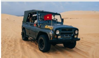
ทะเลทรายขาว