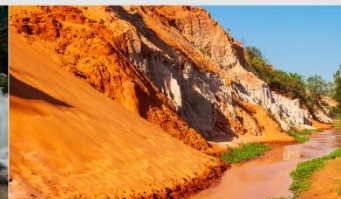
ลำธารนางฟ้า

*ทางบริษัทฯ ขอสงวนสิทธิ์ในการสลับโปรแกรมทัวร์ตามความเหมาะสมขึ้นอยู่กับสถานการณ์หน้างาน โดยคำนึงถึงผลประโยชน์ของลูกค้าเป็นสำคัญ