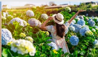
สวนดอกไฮเดรนเยีย