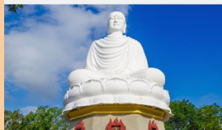
วัดลองเซิน