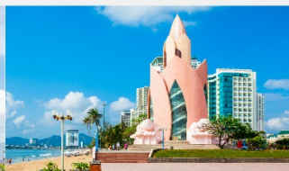
Tram Huong Tower