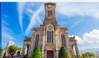
โบสถ์หินญาจาง