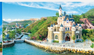
สวนสนุกวินวันเดอร์ส

*ทางบริษัทฯ ขอสงวนสิทธิ์ในการสลับโปรแกรมทัวร์ตามความเหมาะสมขึ้นอยู่กับสถานการณ์หน้างาน โดยคำนึงถึงผลประโยชน์ของลูกค้าเป็นสำคัญ