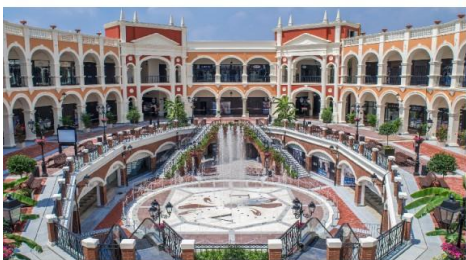
Florentia Village Outlet