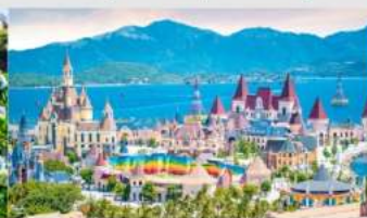
VinWonders NHA TRANG