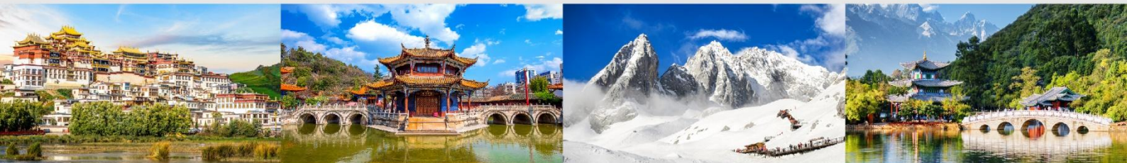
วัดลามะชงจันหลิน