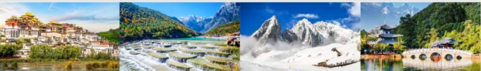
วัดลามะชงจ้านหลิน ทะเลสาบโป๋สุ่ยเหอ ภูเขาหิมะมังกรหยก สระมิงกรดำ