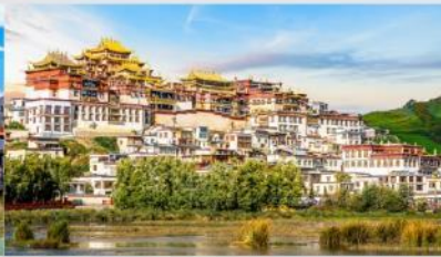
วัดลามะชงจันหลิน