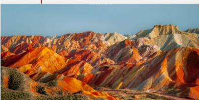
หุบเขาสายรุ้งจางเย่