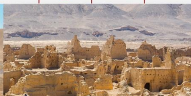
เมืองโบราณเกาซาง