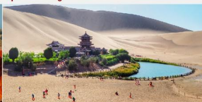
สระน้ำวงพระจันทร์