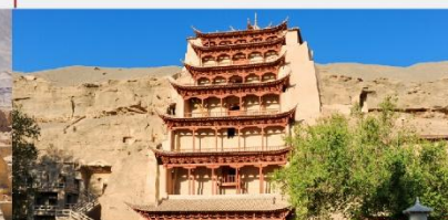
ชมถ้ำหินมั่วเกาคุ