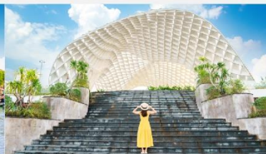
สวนเอเปค