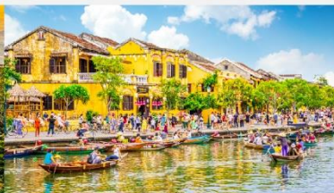
เมืองโบราณฮอยอัน