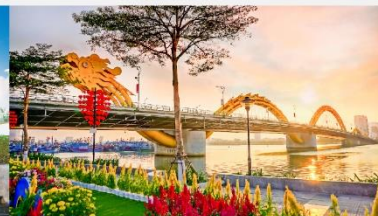
สะพานมังกร