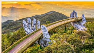
บานาฮิลล์