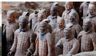
สุสานทหารจีนซี