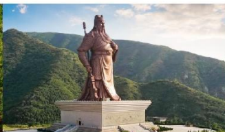
บ้านเกิดท่านกวนอู