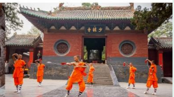
ชมโชว์กังฟูเล่าหลิน

*ทางบริษัทฯ ขอสงวนสิทธิ์ในการสลับโปรแกรมทัวร์ตามความเหมาะสมขึ้นอยู่กับสถานการณ์หน้างาน โดยคำนึงถึงผลประโยชน์ของลูกค้าเป็นสำคัญ