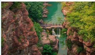
อุทยานสวรรค์หยุนโถซาน