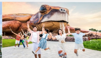
วินเพิร์ล อควาเรียม

*ทางบริษัทฯ ขอสงวนสิทธิ์ในการสลับโปรแกรมทัวร์ตามความเหมาะสมขึ้นอยู่กับสถานการณ์หน้างาน โดยคำนึงถึงผลประโยชน์ของลูกค้าเป็นสำคัญ