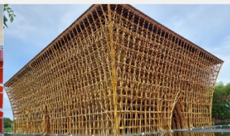
บ้านไม้ไฟ