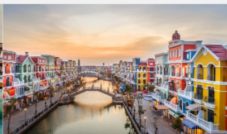
แกรนด์เวิลด์ฟูทิว๊ก