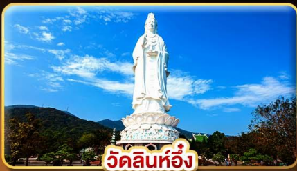
วัดลินห์ฮื่อง